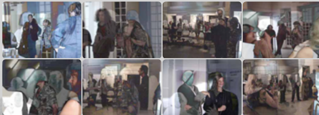
Videostills aus Nomaden der Zeit | Experimentelle Dokumentation 2006