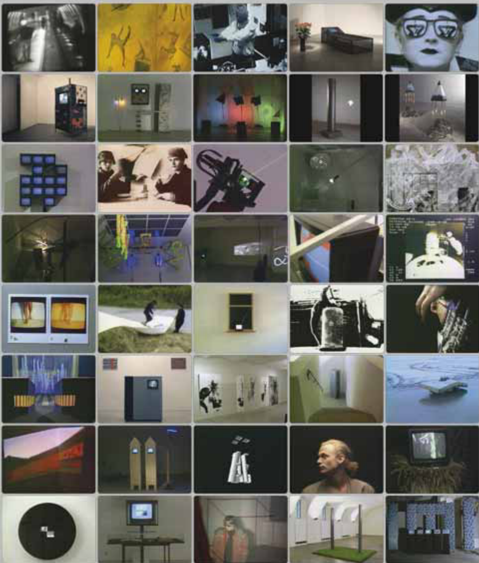
Videostills aus Nomaden der Zeit

Medienkunst aus Österreich von 1969 bis 1990