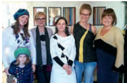
Tuulikki – Fotografie, Schmuck, Textil