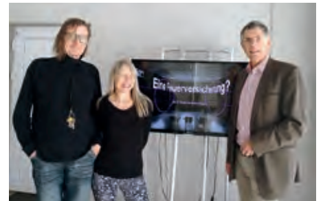
Graf+Zyx – Medienkunst