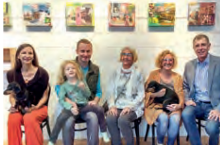
Atelier Gerhard Hiess